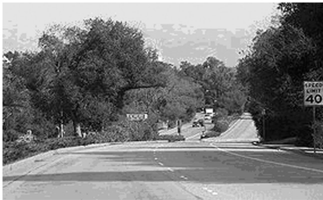
Sand Hill Road. Ничего не видно. Все утопает в зелени

Sand Hill Road — старое, но тогда улица была несколько короче, и чтобы попасть на нее с магистрали El Camino Real, надо было сделать приличный крюк. Экологи и население городка Менло Парк, в котором расположен университет, не соглашались со строительством нового куска дороги, полагая, что это нанесет вред окружающей среде. Переговоры о том, чтобы его построить, продолжались около 30 лет, и в ее современном виде улица существует лишь с 2006 года.