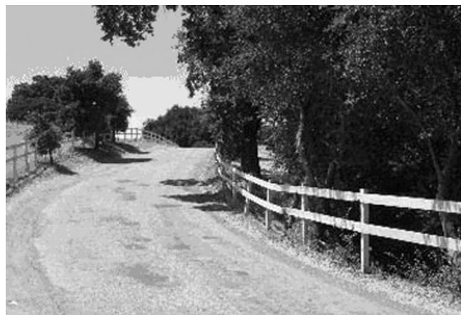
Въезд на Webb Ranch, или дорога в прошлое

Тишина. Отсутствие торопливости. Чувствуешь атмосферу некоей патриархальности и начинаешь ощущать свою отнесенность к большой сельской семье. Детей, не представляющих, что жить можно без Интернета и мобильного телефона, учат чему-то естественному, но забытому — езде на лошадях и