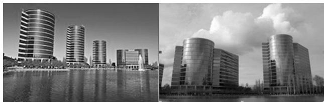
Здания корпорации "Оракл" при разной освещенности

Штаб-квартира фирмы "Оракл" расположена в Redwood Shores и является архитектурным центром этой застраиваемой территории. Комплекс вырос фактически в "чистом по-